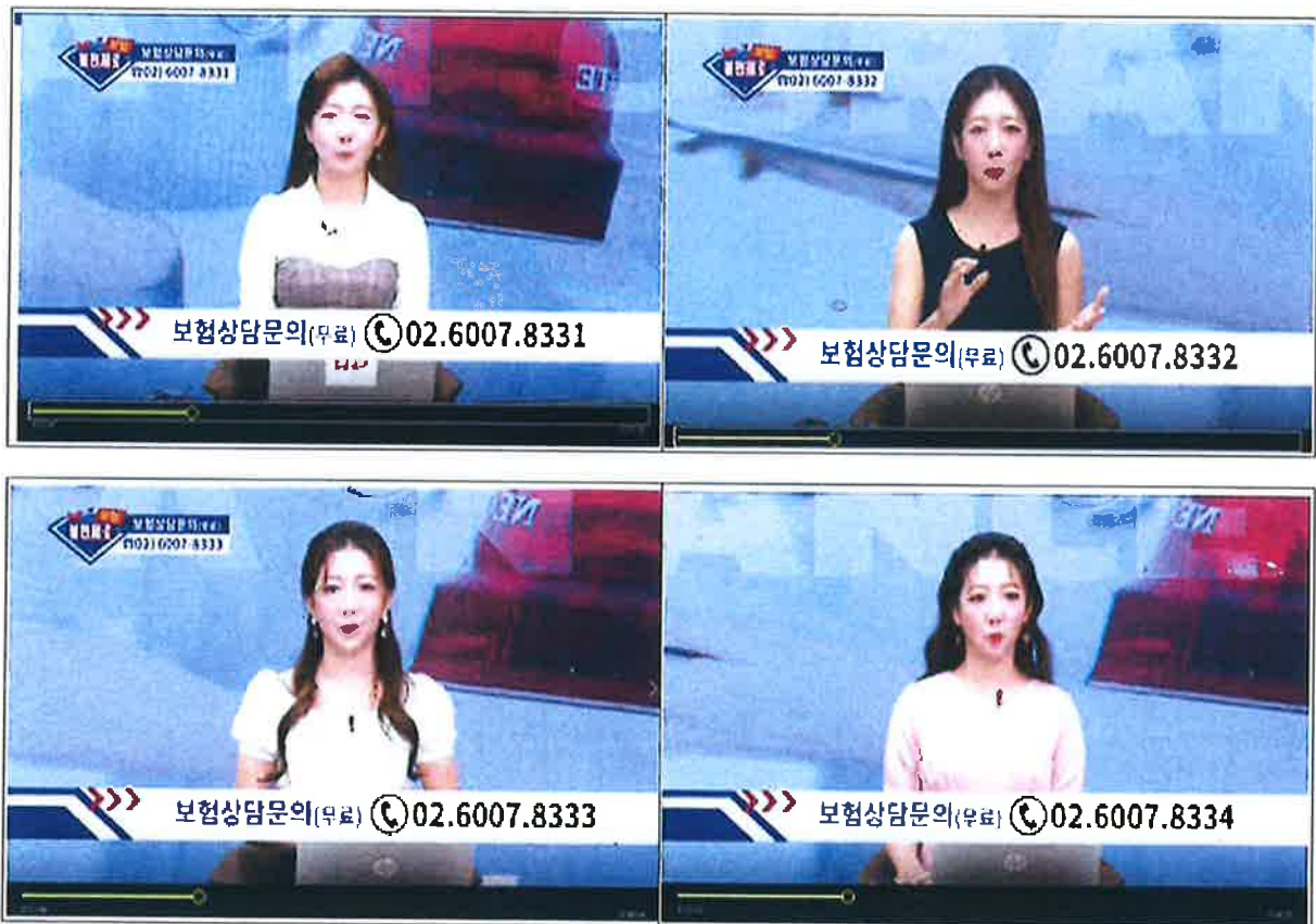
< 그림2, 상담신청 자막고지 화면 >