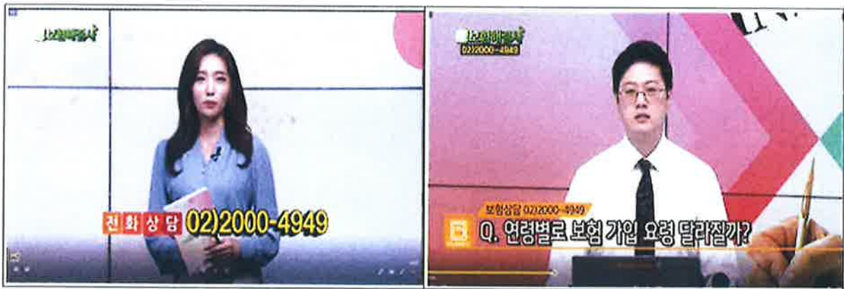
< 표3, 프로그램 진행자 안내내용 >