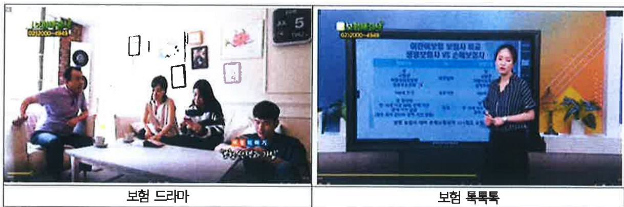
< 그림1, 주요방송 내용 화면 >