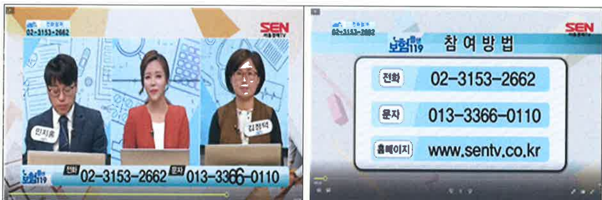
< 그림2, 상담신청 자막고지 화면 >

8 피심인은 방송 도중 상단 왼쪽, 하단 자막 및 전체 화면으로 시청자들에게 보험 상담 참여 방법을 안내하면서 진행자 발언을 통해서도 보험 상담을 권유 하였다.