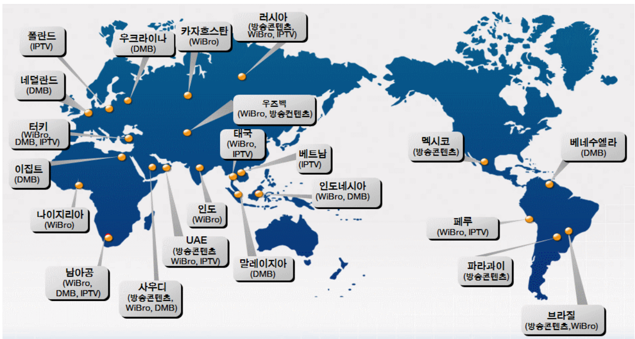
< 해외진출 거점국가 및 진출 추진 분야 >