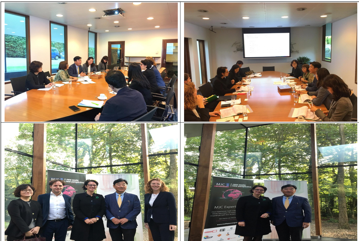
< CvdM 면담 사진 >

o 양 규제 기관이 관련 분야의 정책에 대해 논의를 한 것에 의미가 있으며, 향후 서로 협력하는 데 의견을 같이 함