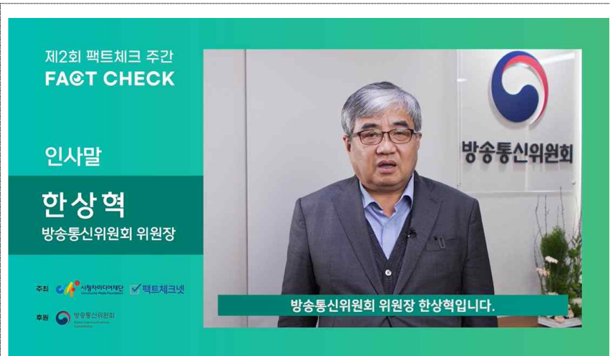
< 한상혁 방송통신위원회 위원장 인사말 >