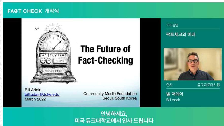
< 빌 어데어 교수 기조강연 >