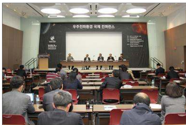
<International Space Radio Environment