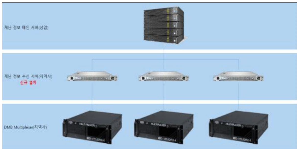
- 재난방송 네트워크 구성도 -